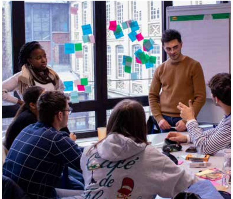
Semaine de l'innovation 2023

Découvrez une école vivante, rythmée par ses traditions, ses associations et une vie étudiante riche en événements. Entre fêtes, sport, culture et engagement, chacun peut trouver sa place et s'épanouir pleinement au sein de l'EIVP !