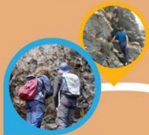
PAYS BASQUE OCTOBRE

Comme tu le sais peut-être déjà, à l'ENSEGID, beaucoup de cours se déroulent sur le terrain, environ 40 jours : 1 semaine au Pays Basque ou en Aragon (dès Octobre donc amène tôt tes affaires), 1 semaine au Salagou, 15j à Narbonne ou en Aragon et d'autres terrains à la journée.