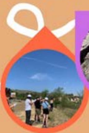
NARBONNE OU ARAGON JUN